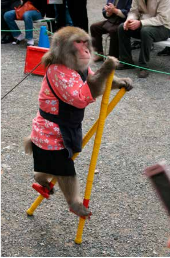
Fig. 5. Spectacle de singes au Japon, 2008.