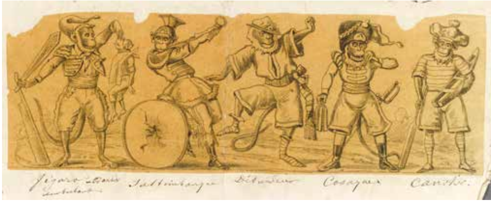
Fig. 4. Singeries, s.d. Marseille, Mucem, RMN-Grand Palais (Mucem)/Franck Raux.

artistiques de singes humanisés, appelées « singeries », font fureur durant la période moderne 30 .