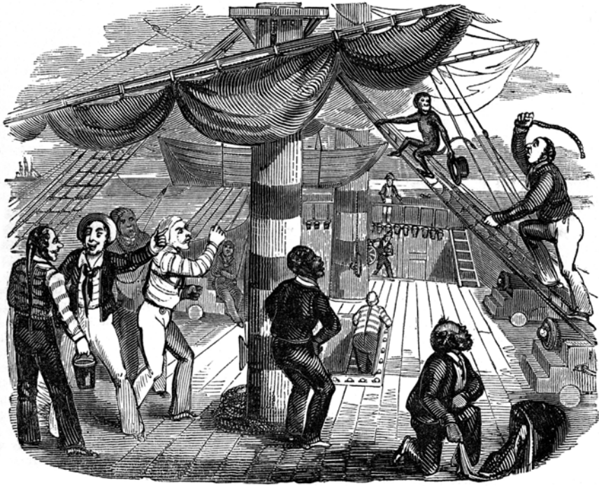
Fig. 3. A Monkey on Board Ship entertains the Sailors by running off with Someone's Hat (1832), dans Pierce Egan's Book of Sports and Mirror of Life , p. 289.

d'apporter sa pâte aussitôt que le singe venait le chercher, sans que ce dernier l'ait jamais induit en erreur 24 .