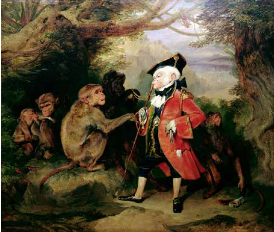
Fig. 2. Edwin Landseer, The Monkey who had seen the World , 1827.

La peinture d'Edwin Landseer pourrait nous induire en erreur sur lui, nous faire croire à un singe matelot qui aurait appris, auprès de l'équipage, à se tenir debout, à se vêtir, à utiliser des accessoires à la mode, et qui, de retour auprès des siens, ne ressemble plus à un singe mais à un gentleman des mers. Nous allons voir que la vérité est tout autre, car il est certain que tous les singes ne sont pas des mascottes. Au XVIII e siècle, une kyrielle d'animaux exotiques sont embarqués vers l'Europe et les rescapés de ces périlleux transferts sont vendus pour une fortune à leur arrivée 13 . À côté d'animaux divers, d'oiseaux multicolores en particulier, les singes sont placés dans les boutiques ou même via des annonces de presse et se retrouvent dans des foyers le plus souvent fortunés. À cette fin, les marins emportent régulièrement des animaux avec eux dans l'espoir d'une revente juteuse à l'arrivée, comme Buffon l'évoque à propos d'un voyage d'un capitaine dénommé May : « Étant avec son vaisseau sur les côtes de Guinée, un de ses matelots y fit l'acquisition d'un petit singe sans queue, âgé d'environ 6 mois, qui avoit été apporté du royaume de Benin 14 . » Durant